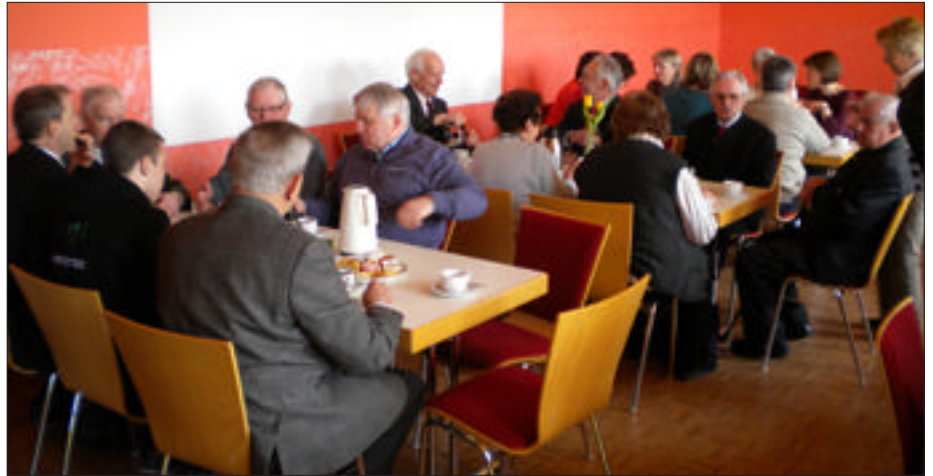
Medienflohmarkt - und Kirchenkaffee des Bibliotheksteams

GESCHENKSIDEE: Bibliotheksgutscheine käuferlich zu erwerben in der Bibliothek und im Sekretariat